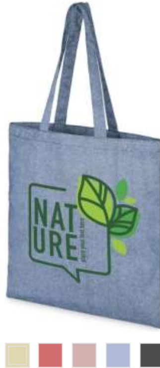
120521 - Pheeb s 210 g/m 2 borsa in Cotone riciclato