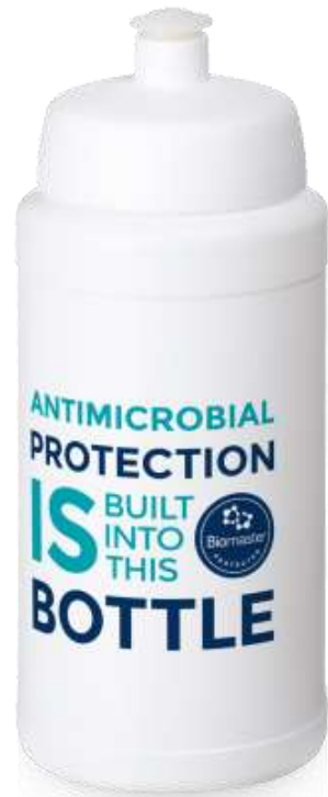
210167 Baseline Plus 500 Pure