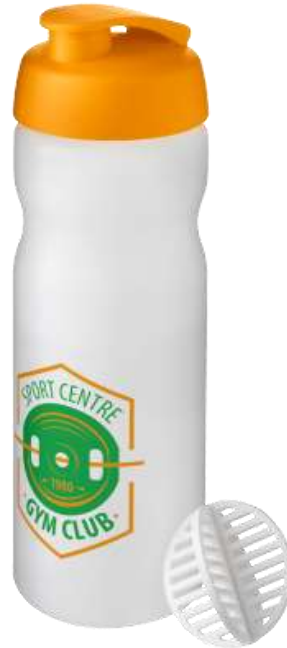
210703 Baseline Plus 650 ml Borraccia shaker