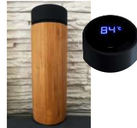
D11 : Bottiglia Smart in bambù FSC