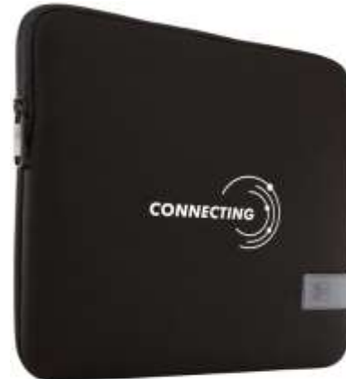
Case Logic Reflect Sleeve