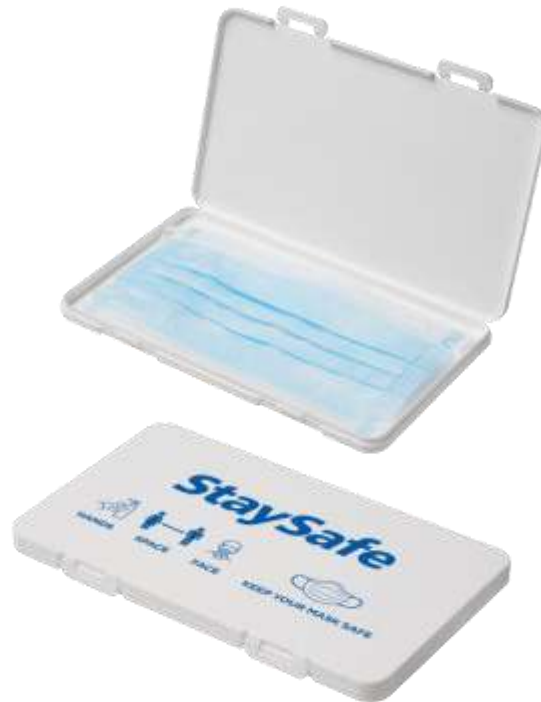
210260 Mask-Safe Antimicrobial Case