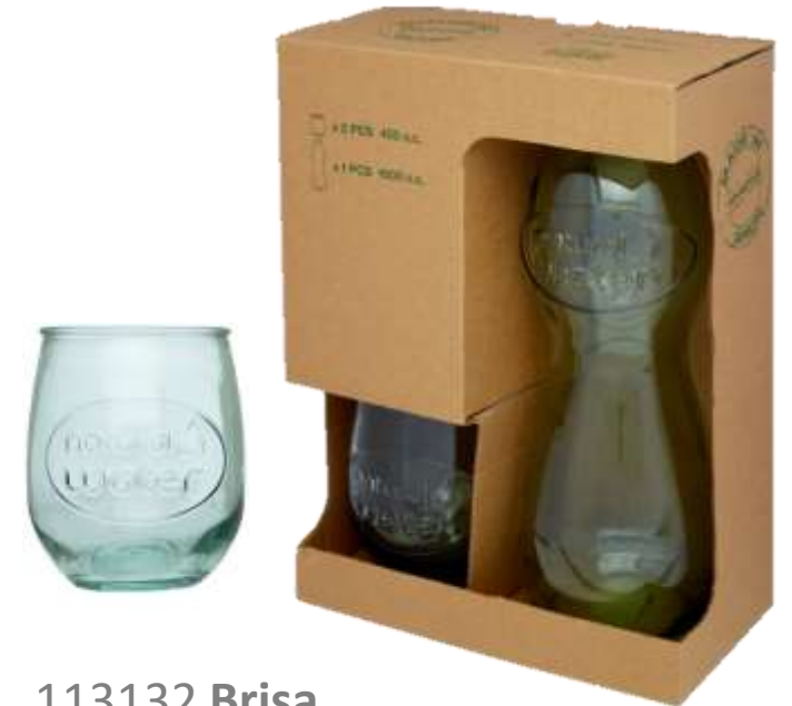
113132 Brisa Set di vetro riciclato in 3 pezzi