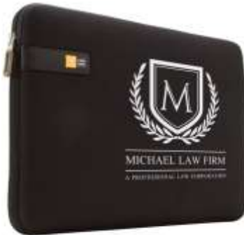
Case Logic Sleeve