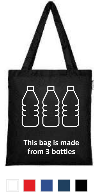
120496 Sai Borsa in RPET