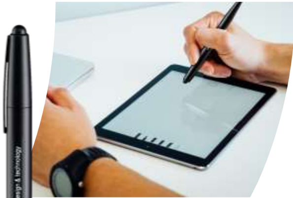
B10: penna a sfera con logo illuminato e touch pen