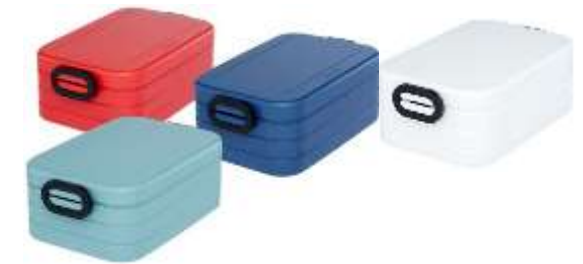
113135 Take-a-Break lunch box