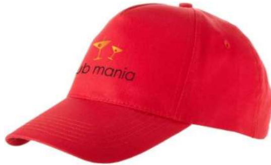
10C001 Swoosh cappellino da baseball 5 pannelli