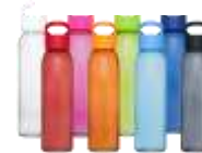
100655 Sky 500 ml Borraccia sport in vetro