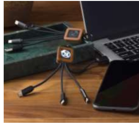
C29 : cavo di bambù 3-in-1 - versione da 1 metro