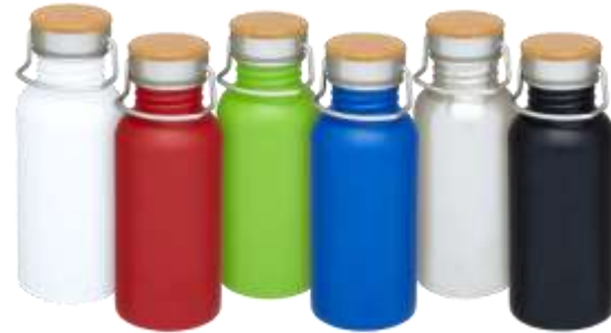
100657 Thor 550 ml Bottiglia sport in acciaio inossidabile