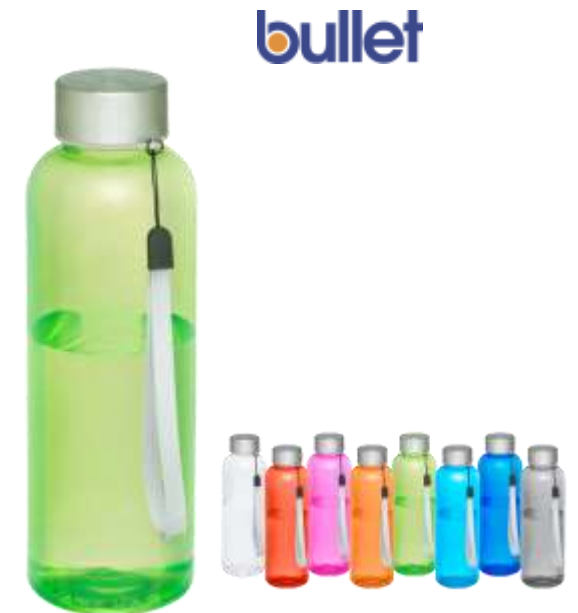
100660 Bohdi 500 ml Bottiglia sport Tritan