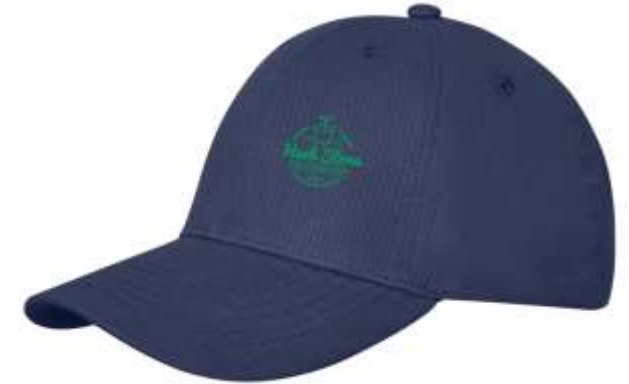
38678 Davis cap 6 pannelli