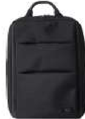
L10 business backpack 10.000 mAh