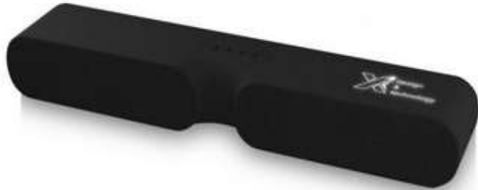
1PX030 S50 2x10W light-up sound bar antibatterico