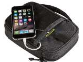
120572– SUBTERRA POWERSHUTTLE