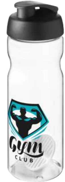
210706 Base attiva H2O Borraccia shaker da 650 ml