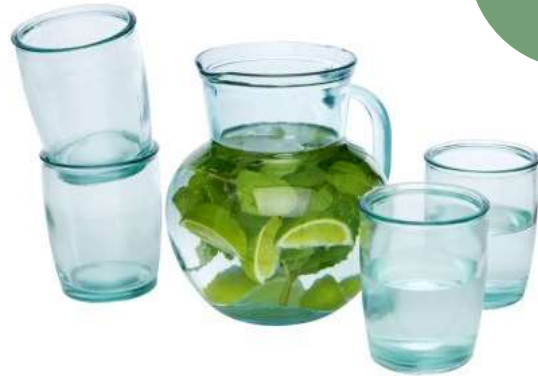
113128 – Terraza Set di vetro riciclato 100% da 5 pezzi