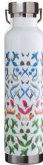
100488 Thor Borraccia sport con isolamento