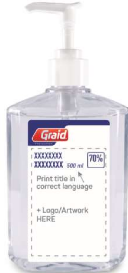
12204 A/B/C/D/E 500 ml gel disinfettante in Borracciacon pompa