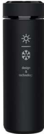
1PX039 D10 insulated smart bottle