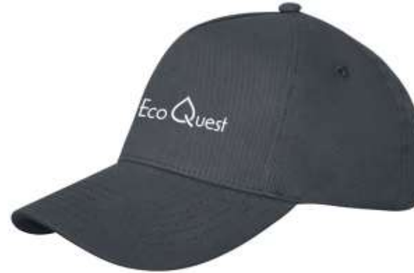
38677 Doyle cap 5 pannelli