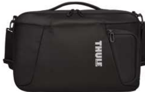
120570 ACCENT 15.6" LAPTOP BAG