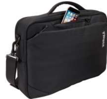
120573 SUBTERRA 15" LAPTOP BAG