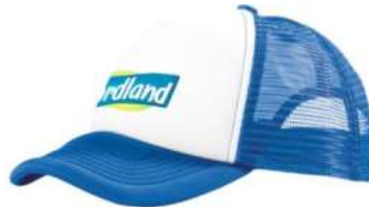
10C005 Port Cappellino camionista precurvo 5 pannelli