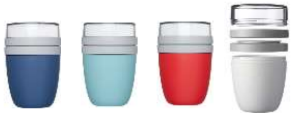
113133 Ellipse lunch pot