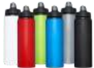
100654 Fitz 800 ml Bottiglia sport in alluminio