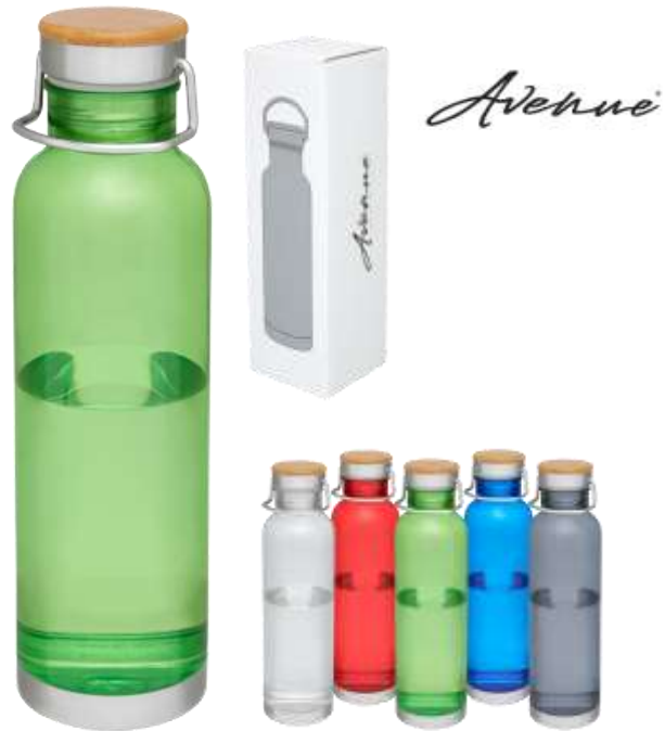
100658 Thor 800 ml Bottiglia sport Tritan