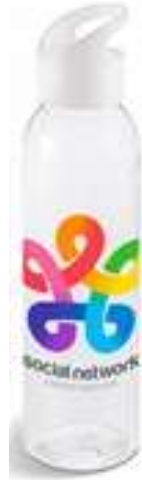
100655 Sky Borraccia sport in vetro