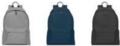
120544 - Baikal Zaino GRS RPET