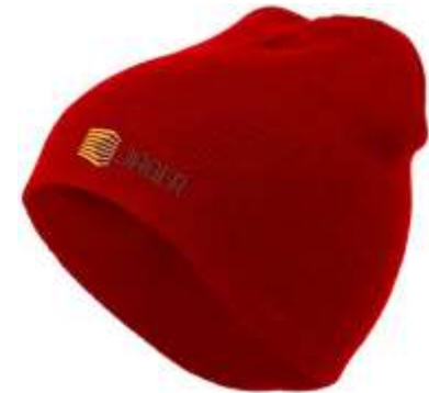
10C013 Senvi Berretto doppio strato