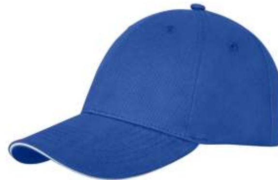
38679 Darton sandwich cap 6 panelli