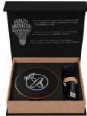
W13 wood wireless charging Base 10W