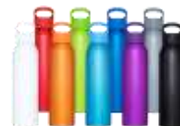
100653 Sky 650 ml Bottiglia sport in alluminio