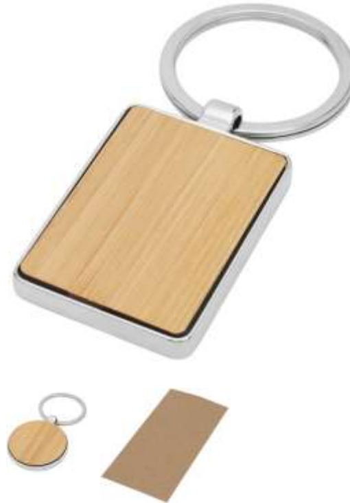
118125/-126 Portachiavi in bambù in involucro in lega di zinco in imballaggio di cartone