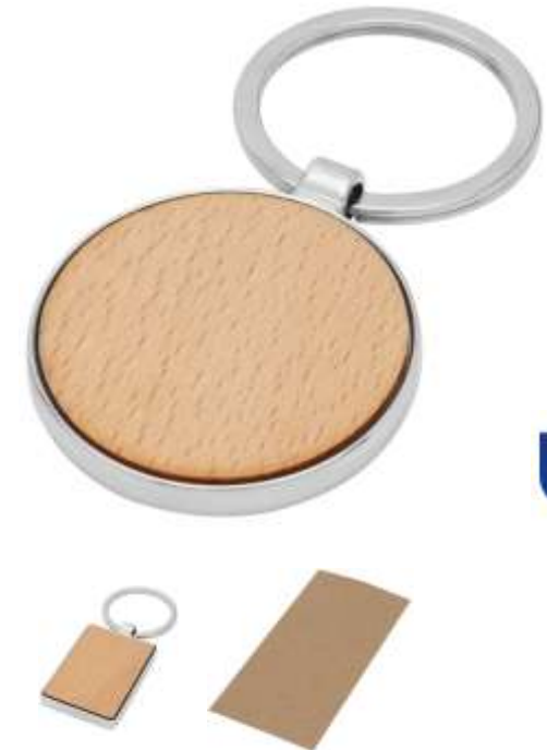
118123/-124 Portachiavi in legno in involucro in lega di zinco in imballaggio in cartone