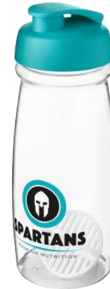
210705 Impulso attivo H2O Borraccia shaker da 600 ml