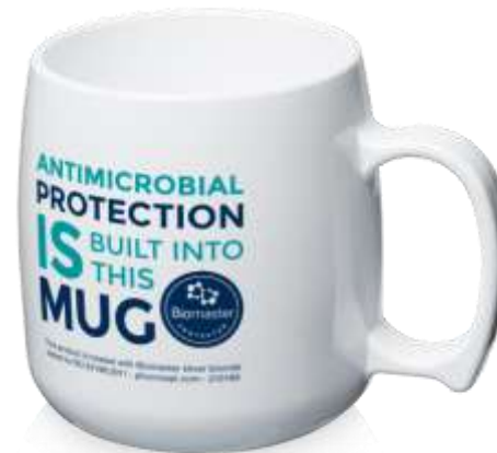
210169 Classic Mug Pure