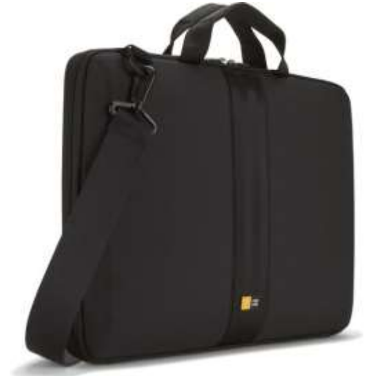
Case Logic handles sleeve