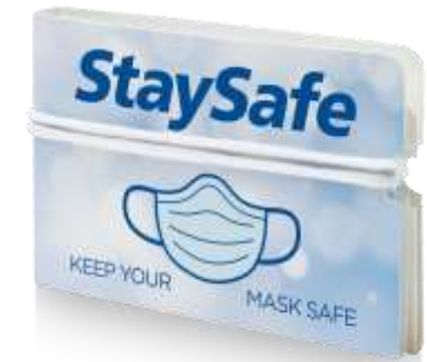
210259 Portafoglio maschera pieghevole Nest