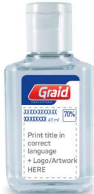
12203 A/B/C/D/E 60 ml gel disinfettante in bottiglia