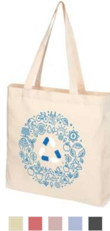
120537 - Pheeb s 210 g/m 2 Borsa con soffietto in Cotone riciclato