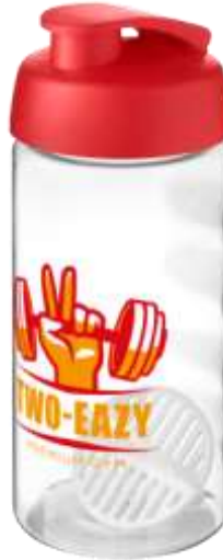
210704 Bop attivo H2O Borraccia shaker da 500 ml