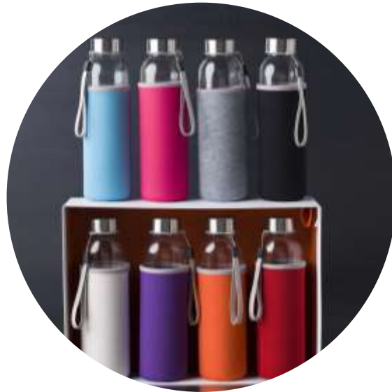
100656 Bodhi 500 ml Borraccia sport in vetro