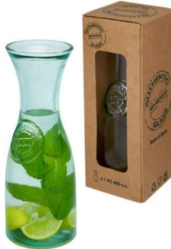
113129 – Fresco Caraffa di vetro riciclato al 100%