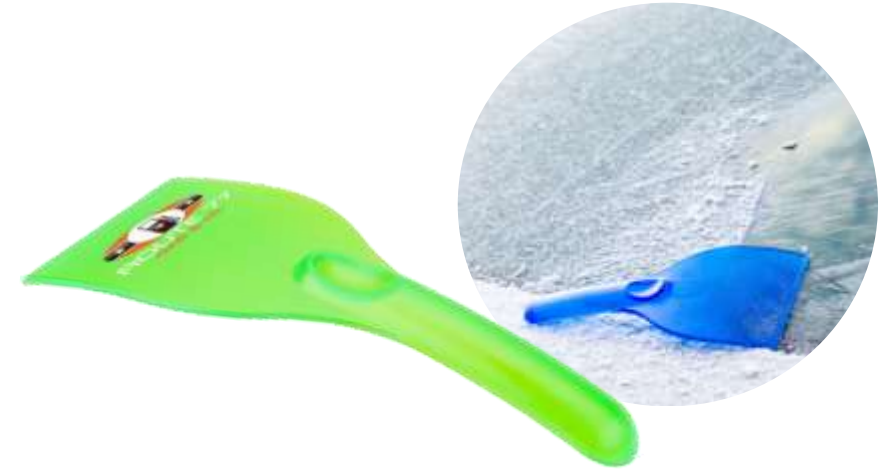
104253 Raschietto per ghiaccio riciclato con manico