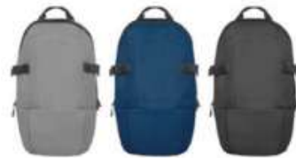
120542 - Baikal GRS RPET Zaino Porta laptop da 15"