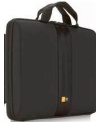
Case Logic handles sleeve