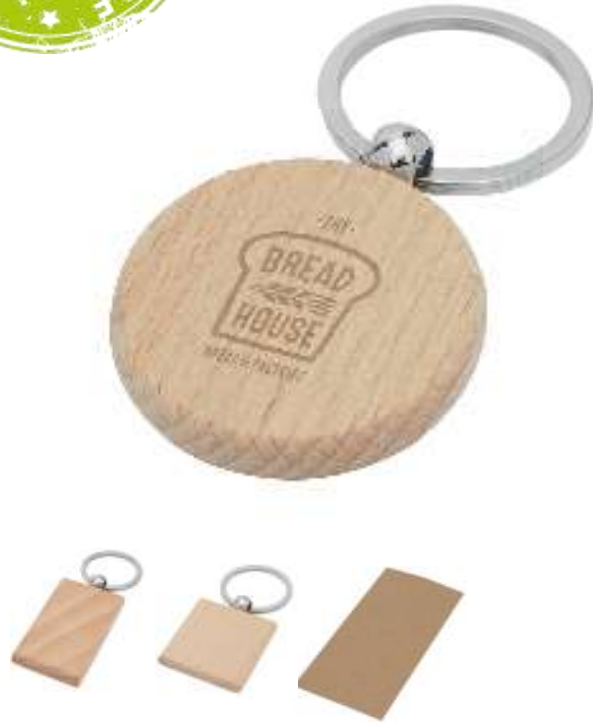
118120/-121/-122 Portachiavi in legno in imballaggio in cartone