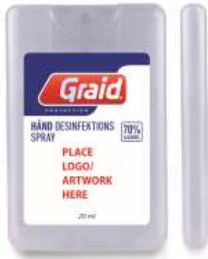
12202 A/B/C/D/E 20 ml spray disinfettante in contenitore

Prodotti testati: EN1276, EN1500, EN1650, EN14476 e non con certificazione uso cosmetico !