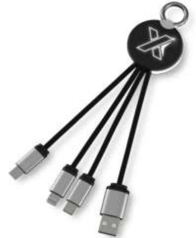
1PX002 C16 ring light-up cable