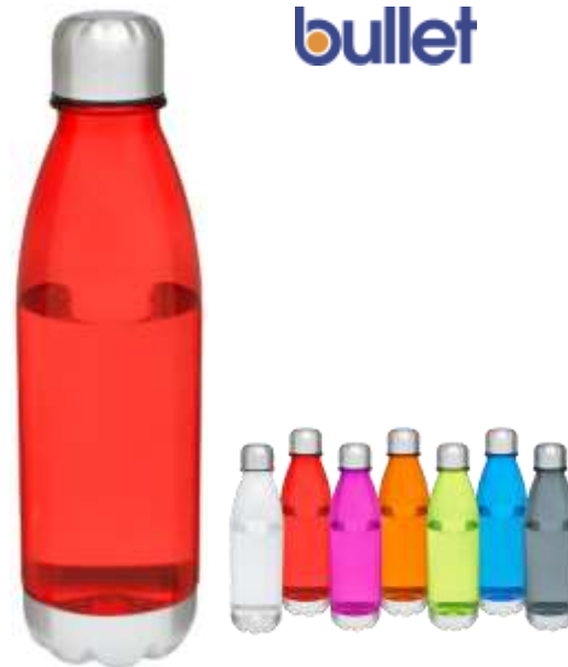
100659 Cove 685 ml Bottiglia sport Tritan