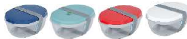
113136 Ellipse salad pot