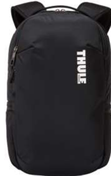
120569 SUBTERRA 15" LAPTOP BACKPACK 23 L