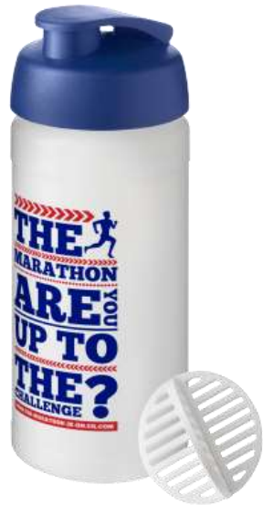
210702 Baseline Plus 500 ml Borraccia shaker