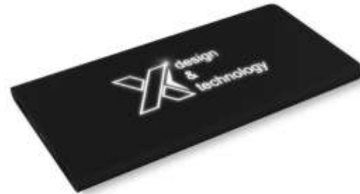
1PX016 P15 light-up 5000 mAh powerbank