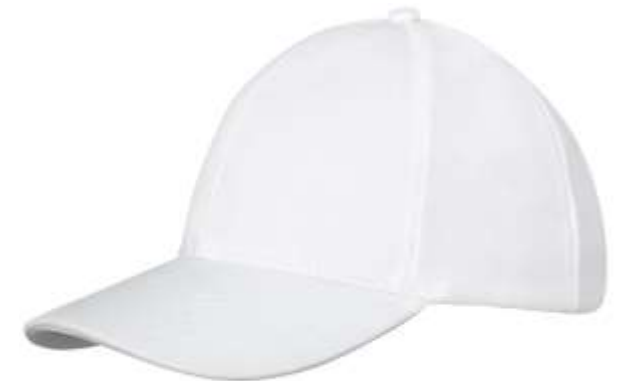
38680 Drake trucker cap 6 pannelli