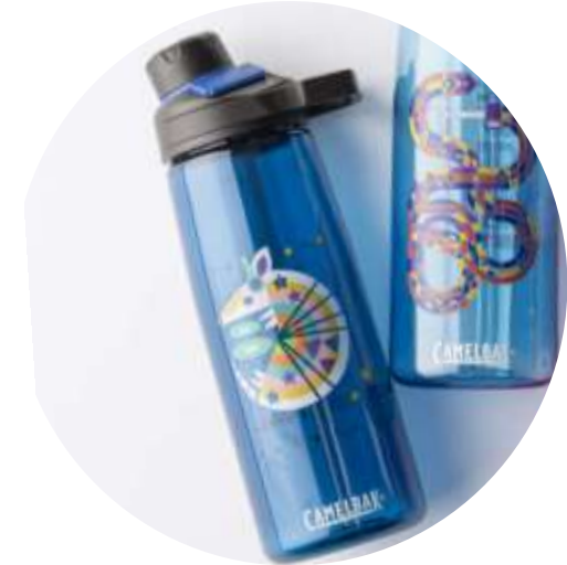
100578 Eddy+ Bottiglia TM Tritan

Stampa digitale diretta in colori CMYK (non PMS) e stampe fotorealistiche Inchiostri utilizzati: UV-LED e Decorazione a 360 gradi fino a 220 mm di altezza