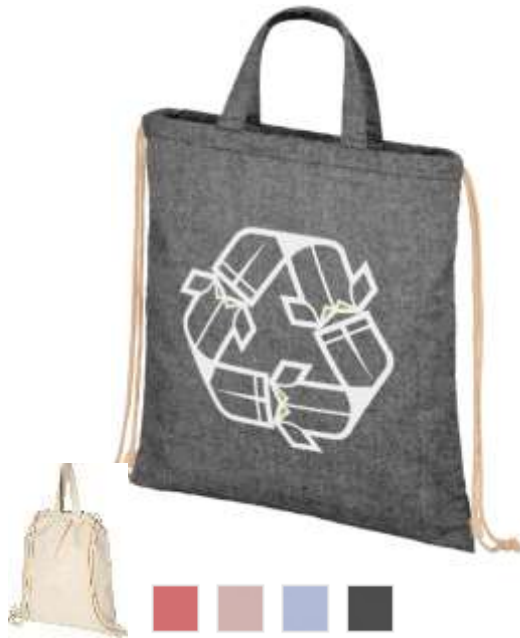
120460 - Pheeb s 210 g/m 2 zaino coulisse in Cotone riciclato