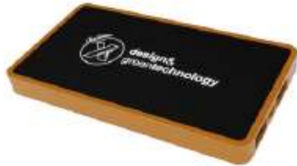
P35 wood powerbank 5000 mAh