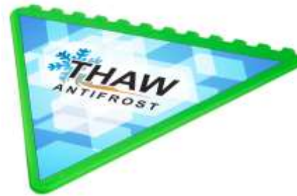
104252 Raschietto triangolare riciclato