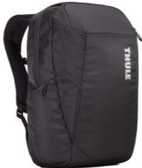
120567 ACCENT 14" LAPTOP BACKPACK 20 L