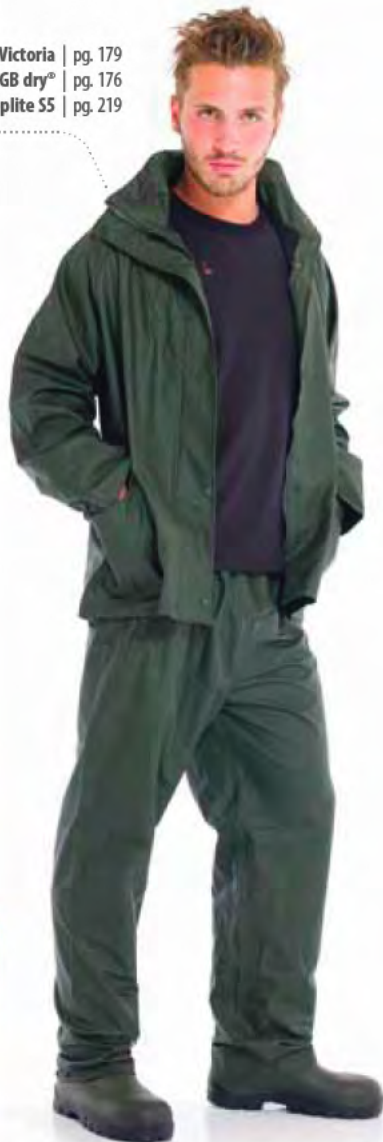
completo Victoria | pg. 179 t-shirt GB dry® | pg. 176 stivale Steplite SS | pg. 219