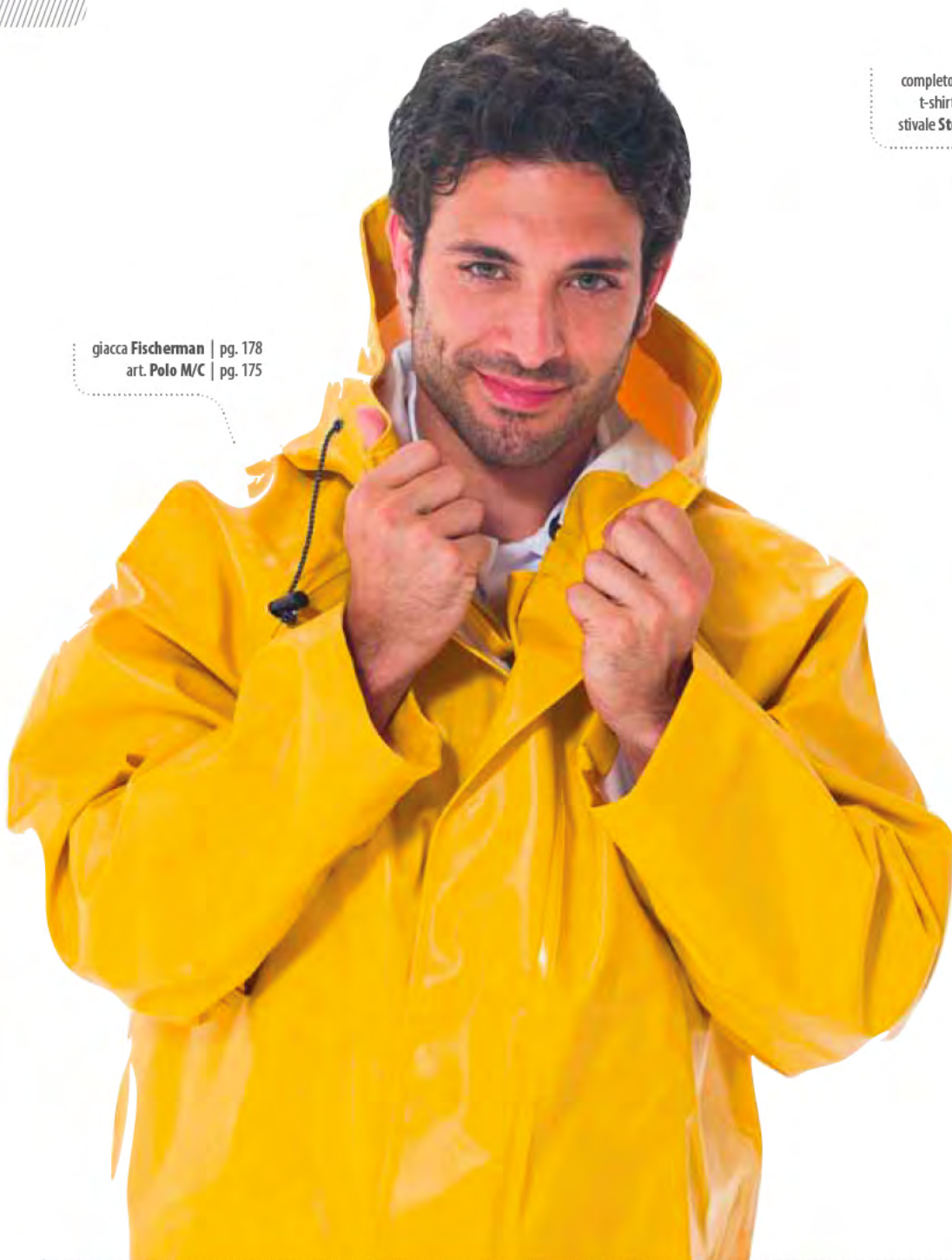
giacca Fisherman | pg. 178 art. Polo M/C | pg. 175